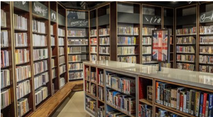
Nederlandse bibliotheken zoeken naar oplossingen