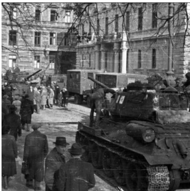
Foto van mensen op straat bij buitgemaakte Russische tanks om de hoek bij de geschiedenisfaculteit van de ELTE-universiteit in Boedapest, 1956.