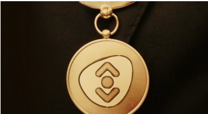
Bibliotheek en gemeente: een waardevolle relatie