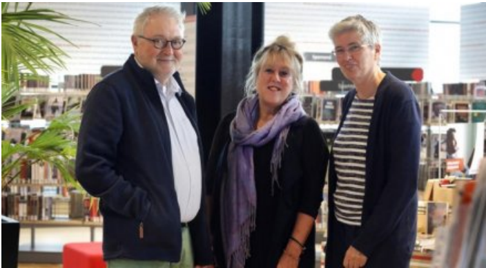
Interview over effectmeting in FlevoMeer Bibliotheek