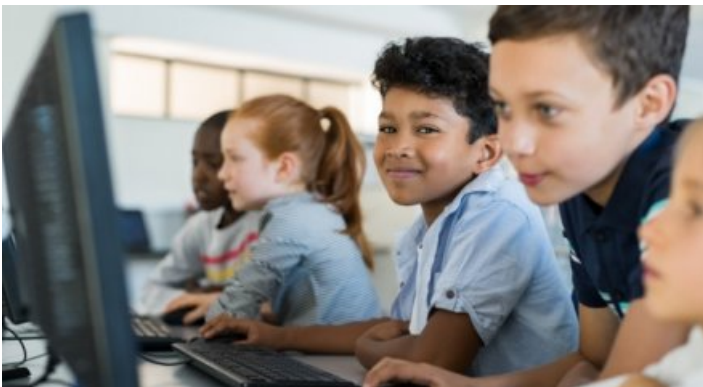
Fact checking: leidt voorlezen écht tot een hogere woordenschat?