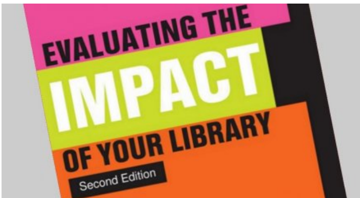
Leestip: impactevaluatie voor bibliotheekorganisaties