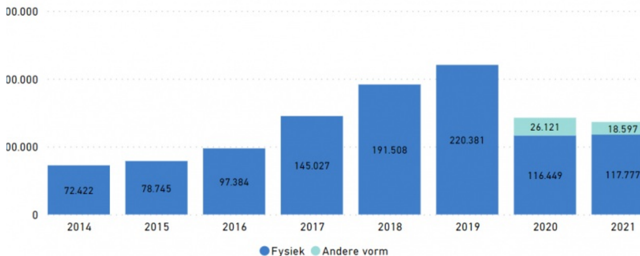
Aantal activiteiten georganiseerd door openbare bibliotheken, 2014-2021*