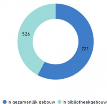
Aantal bibliotheeklocaties in een multifunctioneel gebouw, 2021

In één op de vijf bibliotheekorganisaties is sprake van zo'n bestuurlijke samenwerking of fusie. Het gaat dan om organisaties waarin zaken als bestuur, financiële en juridische zaken gezamenlijk worden opgepakt. Dit komt zowel voor in bibliotheekorganisaties met een klein werkgebied (minder dan 50 duizend inwoners) als in bibliotheekorganisaties met een groter werkgebied (meer dan 50 duizend inwoners). De bibliotheken in een multifunctionele organisaties zijn meestal verenigd in deze organisatie met cultuurinstellingen, zoals een dans- of muziekschool, poppodium of organisatie rondom kunst- of cultuureducatie. Ook met theaters, bioscopen en musea wordt relatief vaak samengewerkt (Van de Burgt & Klaren, 2022).